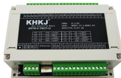
以太网型16路热电偶 型号：KHTH-E-TMCP-16