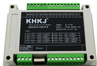
以太网型8路热电偶 型号：KHTH-E-TMCP-8