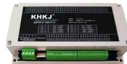
以太网型32路热电偶 型号：KHTH-E-TMCP-32